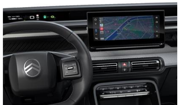
MY CITROËN DRIVE PLUS (MAX)