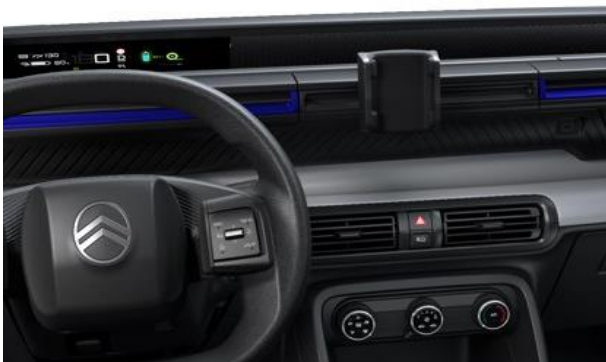
MY CITROËN PLAY (YOU)