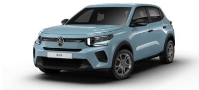
MONTE CARLO BLAU