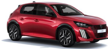
Elixir Rot M5VH – Option