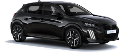
Perla Nera Schwarz M09V - Option