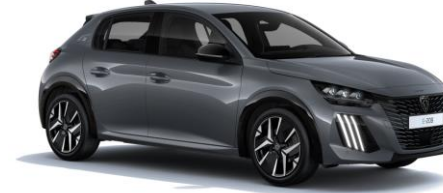
Selenium Grau M0LD - Option