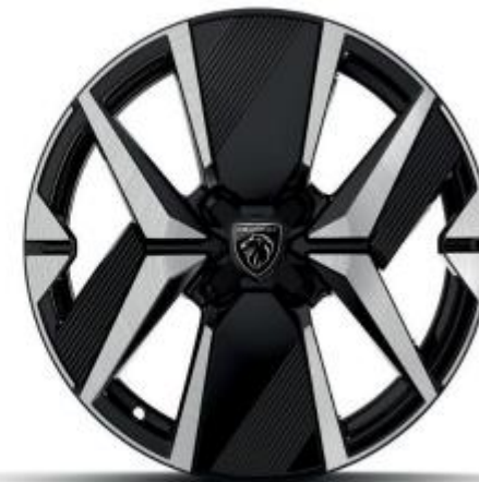
17" Leichtmetallfelge YANAKA