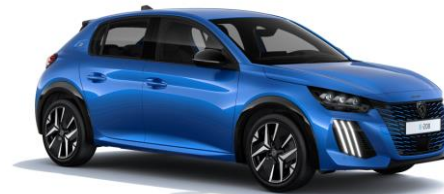
Vertigo Blau M6SM - Option