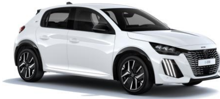
Okenite Weiß M0SU - Option