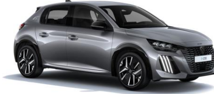
Artense Grau M0F4 - Option